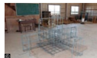
①総合座学風景／②左官・タイル施工科授業風景／③木造建築科教室／④建築板金科教室／⑤とび科教室／⑥鉄筋コンクリート施工科教室