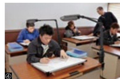
①工作法実技実習/②座学授業風景/③ 測量法実習風景/④建築製図授業風景