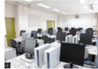
①教室／②木工室／③とび室／④情報処理室