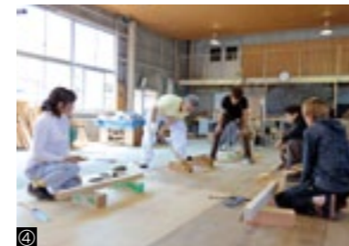
①建築製図科1年生/②木造建築科2年生実習/③木造建築科3年生/④木造建築科1年生実習