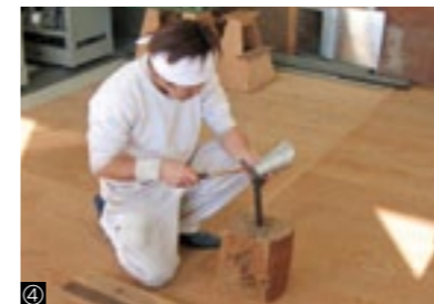
①建築科/②造園科/③配管科/④板金科