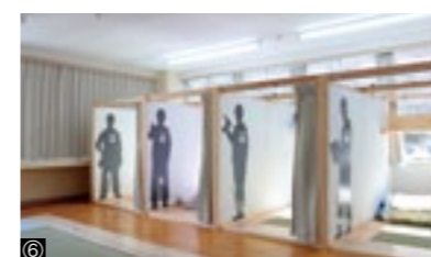
①あいさつ訓練／②工作訓練／③歩行訓練／④はさみ訓練／⑤ビス打ち訓練／⑥宿舎内