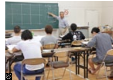
①木工室/②エクステリア室/③日本庭園 /④製図授業