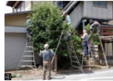
①座学教室／②実習室／③建築科授業／④造園科実習