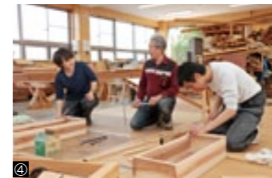
①・②実習室／③・④授業風景