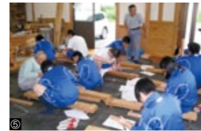
①座学教室／②実習室／③校舎天井／ ④・⑤社会人講師授業