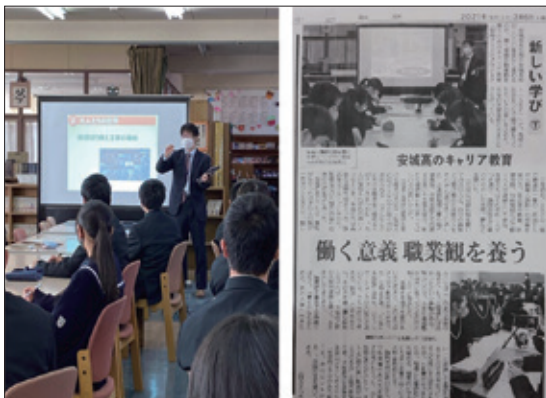
安城高校社会人講話 (中日新聞掲載)

生徒たちも貴重な体験ができたとのことで、後日校長先生より感謝状を頂いた。延べ4回にわたる見学会の実施で、地元住民並びに高校生へ建設業の魅力を PR できたと考える。