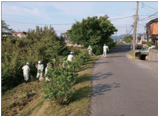
清掃作業・草刈り

地元の夏祭りの会場整備や事務局業務、龍馬ハネムーンウォーク（隼人天降川コース）の維持管理などを初回（平成 20 年 3 月）からサポートし、地域活性化の取組を行っている。