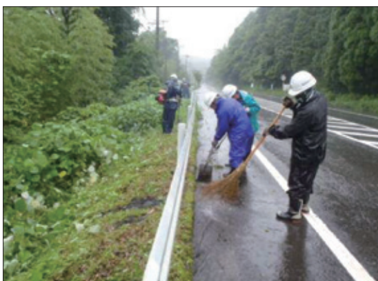
環境美化保全活動

女性定着促進に向けた取組及び男女共に働きつづけられるための環境整備を推進。鹿児島県女性活躍推進宣言企業に登録し、働きやすい現場の労働環境整備、ハラスメント研修の実施による社員の意識改善を行うなど、男女ともに働きやすい職場環境を整備している。