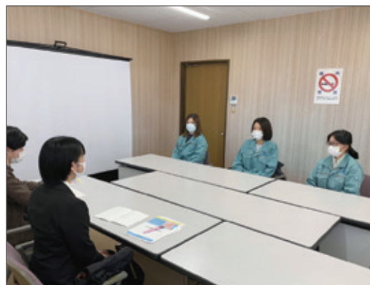
女性の定着促進に向けた取組