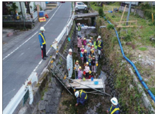
環境保護啓発活動