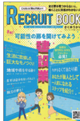
リクルートブック