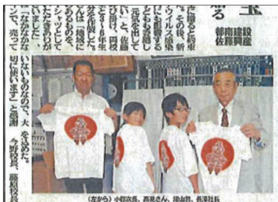
Tシャツのプレゼント

これからも地域に根ざした企業として、地域とのパートナーシップを大切にしながら、さらに発展していけるよう自社の特性を生かした活動を続けていく。