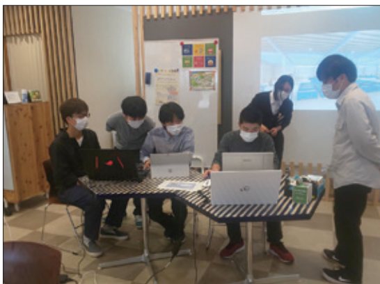
BIM 展示会 学内で学生を指導する社員

イベントを通じて、学生に最新の BIM 技術に触れてもらうとともに、BIM 化/CIM 化が進む新しい建設業の情報発信・魅力発信につながる取組を行った。