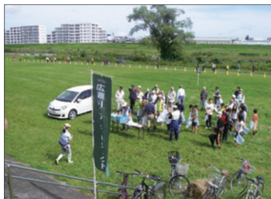
広瀬川の清掃活動