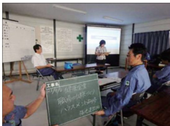
ハラスメント研修