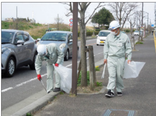
いつも利用している車道に感謝を込めてゴミ拾い

清掃活動は、毎年 4 月、8 月、12 月の第 1 土曜日の午後に、社員全員参加で実施。ゴミはゼロにはならないが以前より確実に減少、学生たちの美化意識の向上を感じている。