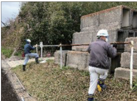
市の資材置き場の整備

各工事現場にて工事にご協力頂いている地域住民の皆様へ感謝の意を込めて、地域でのお困りごとに対応。令和2年度は、小学校体育館の雨といの清掃、運動会の設営で編成所のゲート支柱を設置する等の協力を行った他、地元自治会要請による市道上の樹木の伐採や市の資材置場の整備等、地域に貢献できる建設業を目標に例年取り組んでいる。