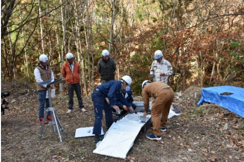
(スターリンクの組立て)