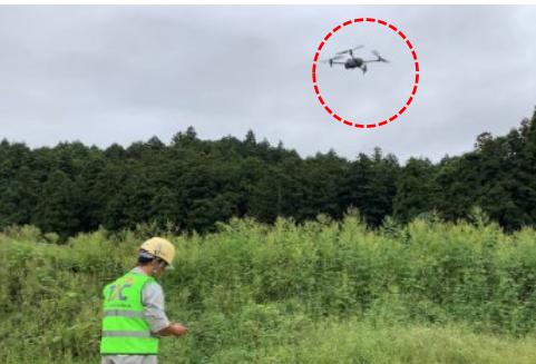
（ドローンによる空撮）