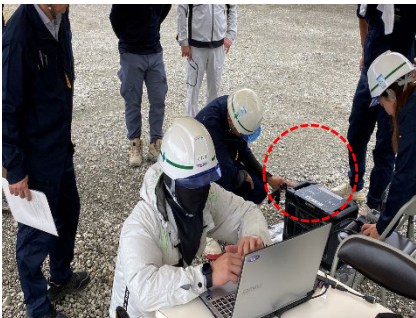
（ポータブル電源の活用）