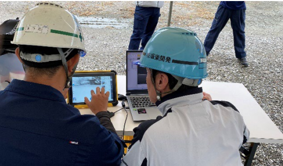
（点群処理ソフトによる状況把握）