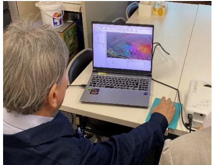
（ノートPCによる情報共有）