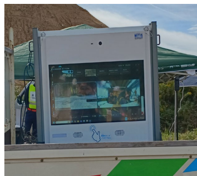
（ドローンで撮影した被災箇所の情報共有）