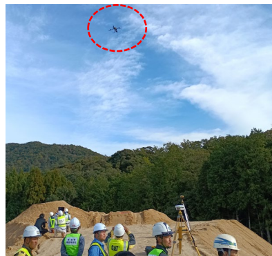
（ドローンによる被災箇所の状況確認）