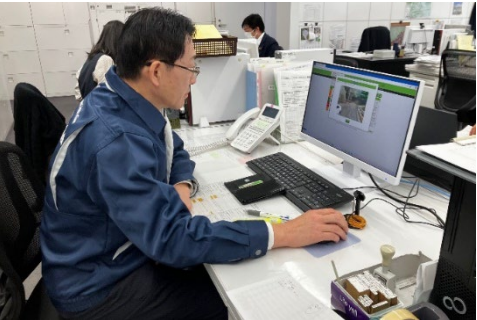
(災害対策本部とのリアルタイム情報共有)