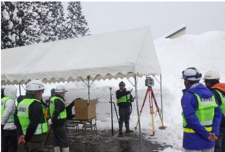
（レーザースキャナーでの測量）