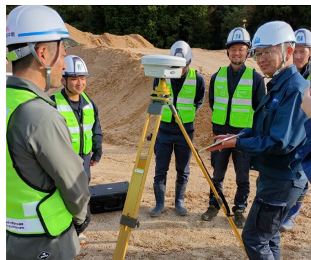
（GNSSローバーの使い方講習）