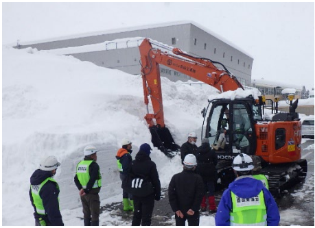
（ICT建機を用いた排雪）