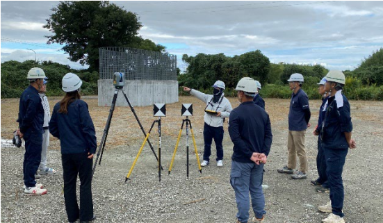
（レーザースキャナーによる三次元データ取得）