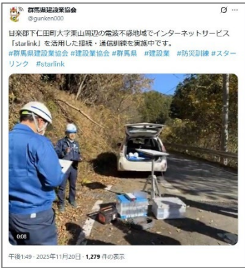
(スターリンクを用いた電波不感地域の状況報告)