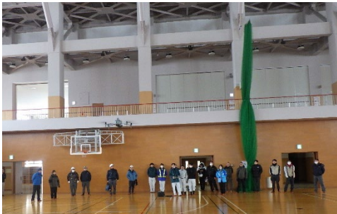
（ドローンによる崩落箇所の確認、測量）