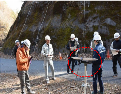
(スターリンクの設置)