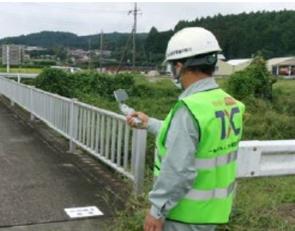
（ウェアラブルカメラによる点検・情報共有）