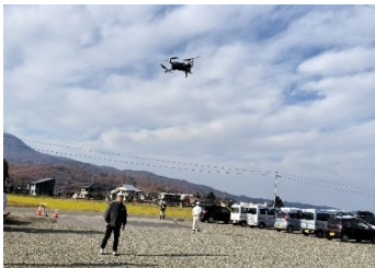
（ドローンによる被災箇所の3D測量）