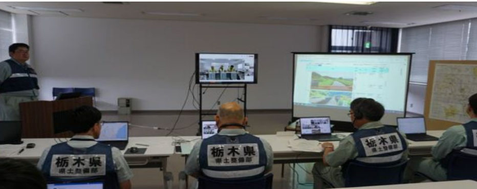
（災害対策本部とのリアルタイム情報共有）