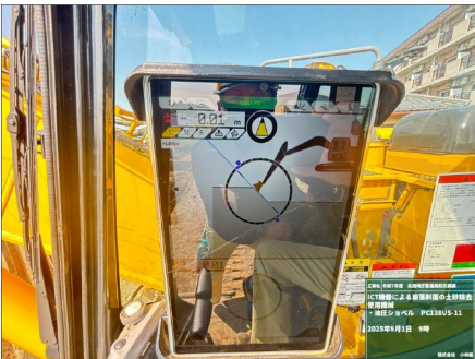
(マシンガイダンスによる操作状況)