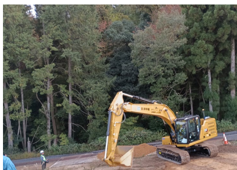
（ICT建機の遠隔操作による崩落土砂撤去）