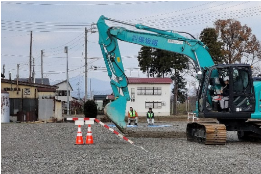
（ICT建機を用いた自動制御での掘削のイメージ）