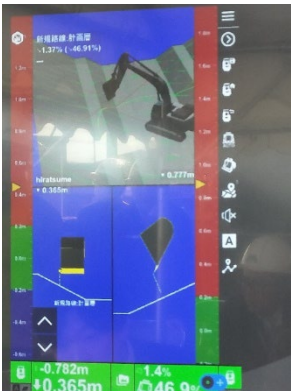
（施工箇所の可視化）