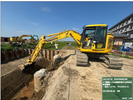
(ICT建機による崩落斜面の土砂撤去)