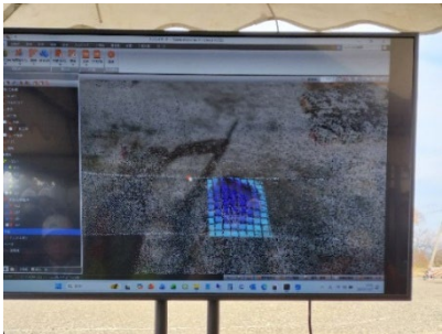
（被災地の差分分析）