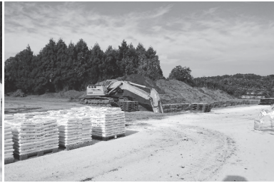
【鳥インフルエンザ】城里町の養鶏場の防疫措置での埋却箇所掘削及び埋却作業（令和5年1月） （一社）茨城県建設業協会