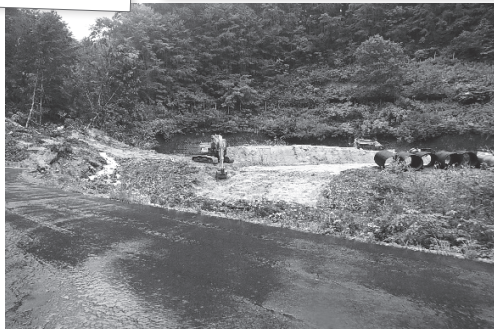
国道105号線土砂撤去、仮設道路設置 (8月の前線による豪雨) (一社)秋田県建設業協会