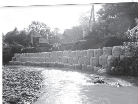
道道の遠別中川線で道路法面復旧作業 (8月の集中豪雨) (一社)北海道建設業協会