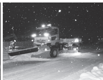
暴風雪（令和5年1月23日～）の影響により夜を徹した国道8号の除雪作業 （一社）富山県建設業協会