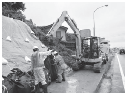
国道4号土砂流出による撤去等作業の様子 (7月の前線による豪雨) (一社)宮城県建設業協会