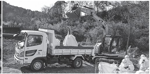
【鳥インフルエンザ】佐伯市の養鶏場の防疫措置での埋却箇所掘削、埋却、埋め戻し作業（令和5年1月）

※令和4年10月28日に国内1例が確認されて以来、令和5年4月14日14時現在までで26道県で84事例発生し、約1,771万羽の処分を行っている。