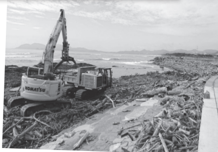
延岡港海岸で台風14号による漂着物撤去 (9月の台風14号) (一社)宮崎県建設業協会