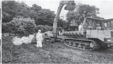
【豚熱】那須烏山市の養豚場の防疫措置での埋却箇所掘削および埋却作業（7月～9月）