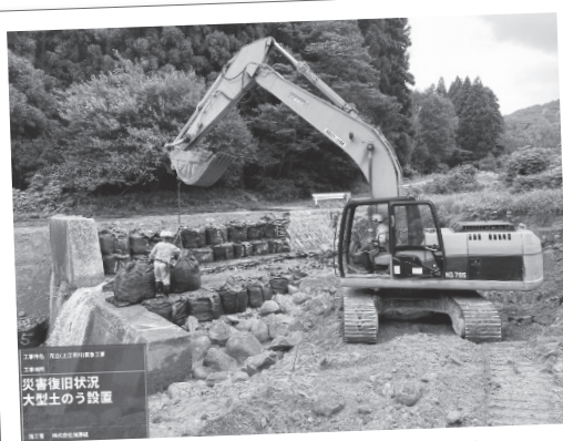
上江沢川での土石流による緊急復旧作業 (8月の前線・台風8号による豪雨) (一社)新潟県建設業協会