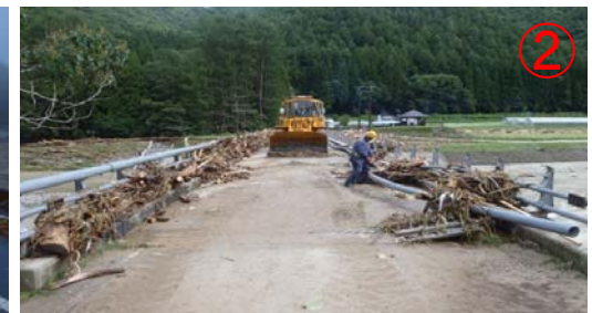
山口支部 (株)館岩工務所 2015.9.11 南会津町