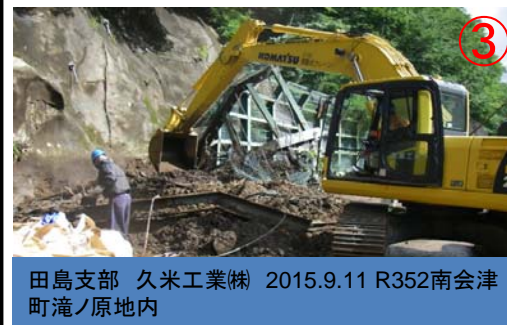
田島支部 久米工業(株) 2015.9.11 R352南会津町滝ノ原地内