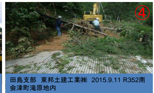
田島支部 東邦土建工業(株) 2015.9.11 R352南会津町滝ノ原地内